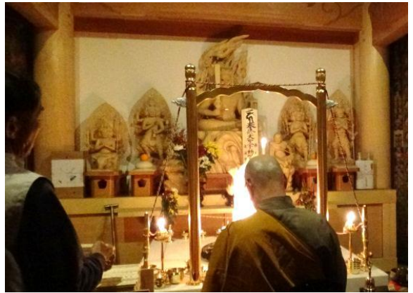
年中行事(12月 除夜の鐘)